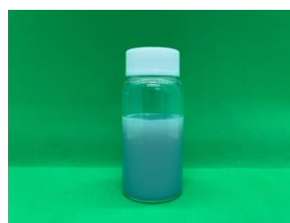
③高透明抗菌抗ウイルスコーティング液