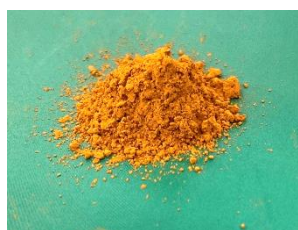
①新規負熱膨張性粉末 (CZVPO)