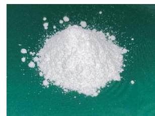
①新規負熱膨張性粉末 (ZSP)