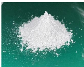
①新規負熱膨張性粉末 (ZMP)