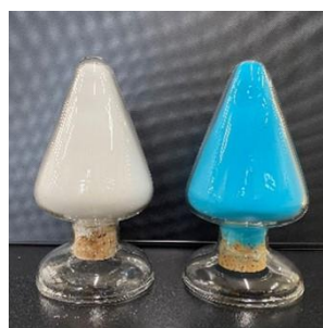
⑤MOF/PCP (金属有機構造体/多孔性配位高分子)