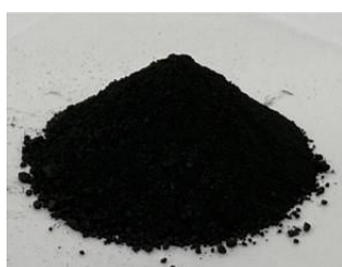
②NIR 透過膜用黒色粉末